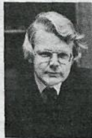
Ólafur Ragnar Grímsson